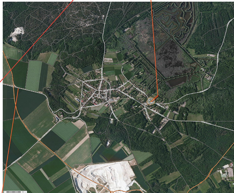
LOCALISATION DE LA PARCELLE PAR RAPPORT À LA VILLE